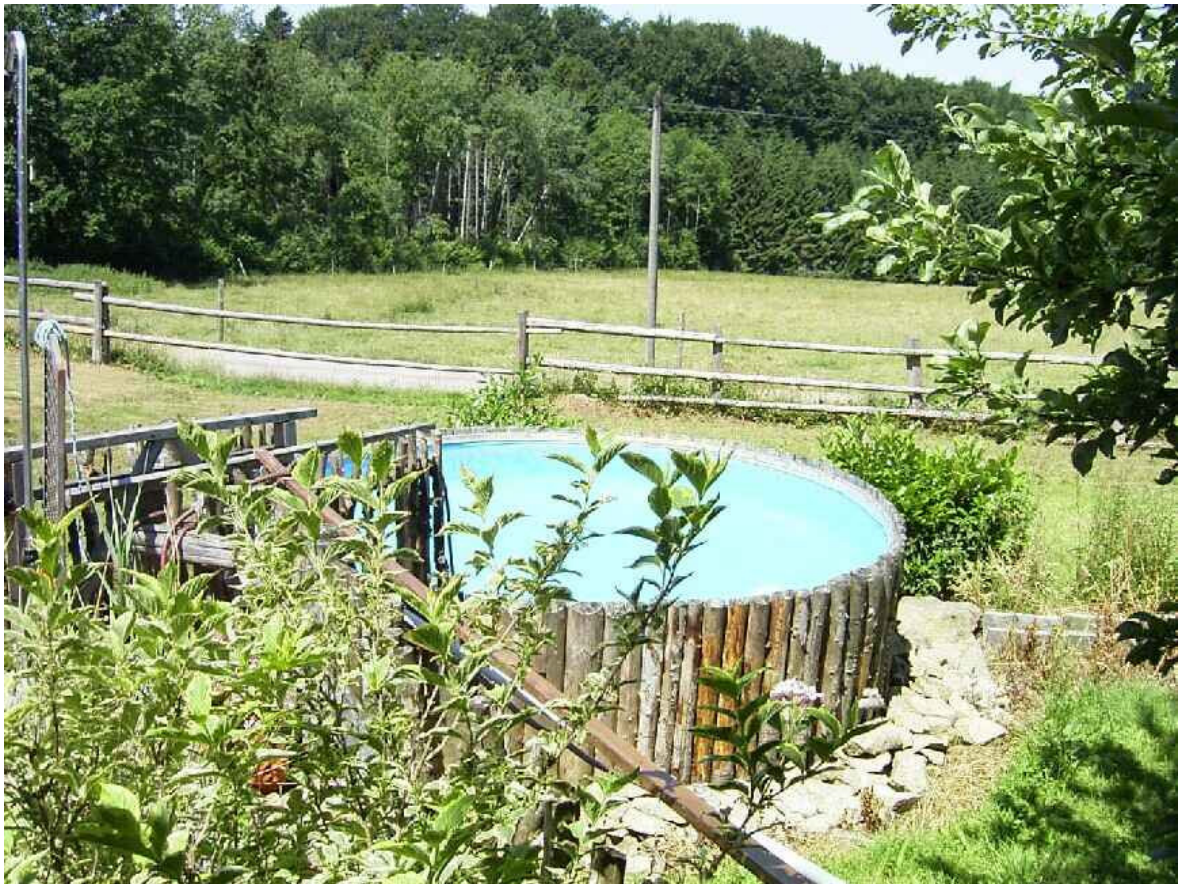
Der "Pool" .....