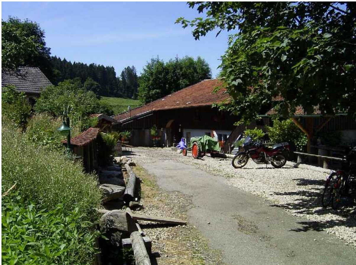
Die "Ferne", Hofeinfahrt